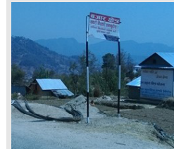
थाहानगरको शिखरकोट नजिकै राखिएको ट्राफिक सचेतना बोर्ड ।

यसैबीच थाहानगरका विभिन्न क्षेत्रमा राखिएको ट्राफिक सचेतनाका सन्देशहरू सवारी चालकहरूले पढ्ने नगरेको गुनासो छ । विद्यालय क्षेत्रमा राखिएको बोर्डहरूलाई ख्याल नै नगरी सवारी साधन हाँकेने गरेको अभिभावक तथा शिक्षकले बताएका छन् । थाहा नगरपालिका वडा नम्बर ४ मा रहेको हिमालयन बोर्डिङ स्कूलले राखेको 'विद्यालय क्षेत्र' अंकित बोर्ड त सवारी साधनकै ठक्करबाट ढलेको बताइएको छ । यसरी सन्देश पनि नपढ्ने तथा ट्राफिक नियम पालना नगरेपछि नगरमा दुर्घटनाको