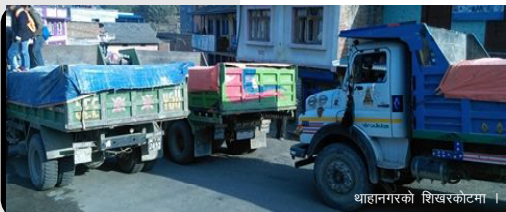
थाहानगरको शिखरकोटमा ।

नगर क्षेत्रका व्याप्य सडकहरूमा अटेर गरी टहरा राखी नहटाउने र निर्माण सामग्री थुपार्नेलाई व्यवस्थित गर्न नगरपालिका लागि रहेको प्रमुख