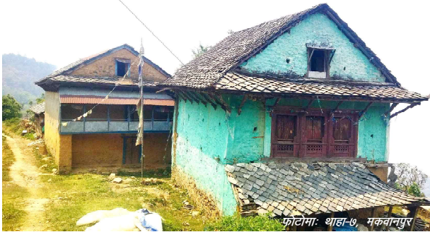
फोटोमा: थाहा-७ मकवानपुर

मकवानपुरका दश वटै स्थानीय तहका गाउँ-गाउँमा विकास थपिदै गएको छ । तर, गाउँबस्ती भने पछिल्लो समय रित्तिदै गएका छन् । मकवानपुरका पहाडी क्षेत्रबाट बेसीतिर फर्नेहरूको संख्या दिनहुँ बढ्दै गएको छ । विशेषगरी मकवानपुरका स्थानीय सरकारले विकट गाउँलाई प्राथमिकता दिएर सडक, खानेपानी र बिजुली पुऱ्याउनका लागि काम गरेका छन् । वस्ती भने रित्तिदै गएको छ । विकास गाउँ पस्न्यो मानिस शहर । जिल्लाका पहाडी क्षेत्रमा विकास र मानिसबीच बेजोडको लुकामारी छ । विकास थिएन, मानिसको चहलपहल गाउँ-बस्तीमा बाक्लो थियो । विगतको तुलनामा सडक पुलपुलेसा बनेका छन् । बिजुली र सञ्चार सुविधा घर-घरमा पुगेको छ । टोल-टोलमा खानेपानीको पहुँच छा विद्यालय र स्वास्थ्य चौकीहरू थपिएका छन् । धुले सडकहरू स्तरोन्नति हुँदैछन् ।