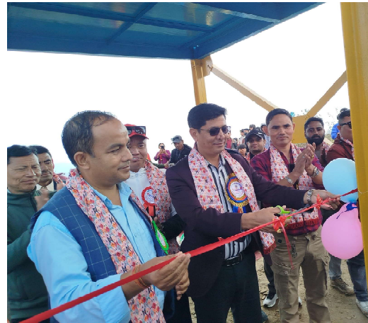
कैलाश-बैकुण्ठ जीपलाइन उद्घाटन गर्दै पालिका अध्यक्ष, उपाध्यक्ष तथा प्रतिनिधिहरू।

कैलाश गाउँपालिका-२ नम्बर वडाको बैकुण्ठ डाँडामा रहेको स्टेसनबाट चढेर कैलाश डाँडासम्म जीपलाइनमा यात्रा गर्न गर्न सकिन्छ। कैलाश गाउँपालिकाको नामाकरण भएको कैलाश डाँडा र बैकुण्ठ